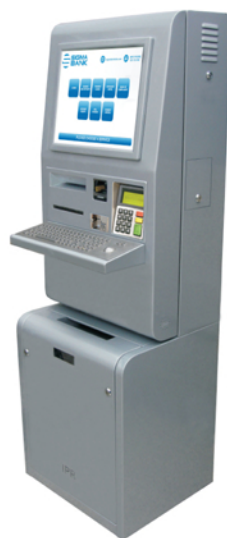
Plaćanje računa & EFT POS