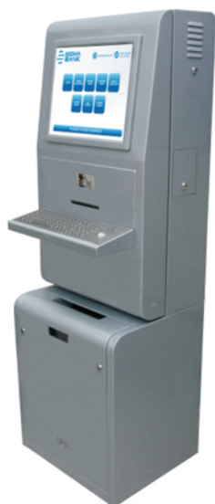
Pisa č izvoda